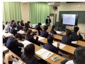
<二宮先生の話に集中>