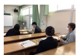
<ペアワークで協議>