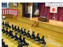
&lt; 在校生送辞 &gt;