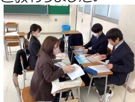
&lt; 多数の生徒が聴講した就職講座 &gt; &lt; 専門学校の説明に傾聴 &gt;