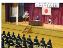
&lt; 卒業生答辞 &gt;