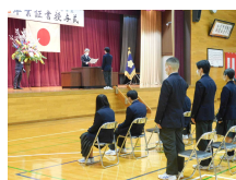
&lt; 卒業証書授与 &gt;