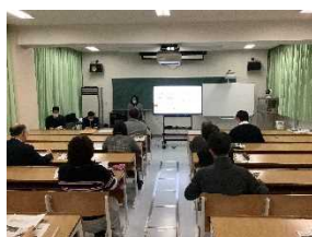
<定期的な教職員研修で知識の再検証・アップデートは重要です>