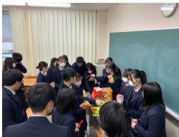
<卒業間近のひととき>