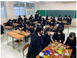
<学年での集合風景>

1月18日(木)LHRに3年生が自分たちで考え企画した学年で最後の集会を開きました。コロナ禍の影響が大きかった中で、生徒たちは、自ら行動して学級を超えた学年の結束力をみせてくれました。仲間と協働してゲームをしたり、お菓子を用意して語り合い、来週の学年末考査に向けて励まし合い全員で卒業するぞ!と誓い合って楽しいひとときを終えました。