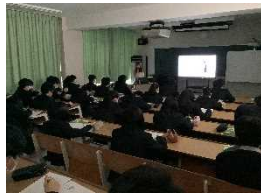
<お話に没頭する生徒>