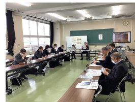
<学校概況を説明する校長>