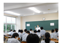
<校長講話> <生徒指導部の話> <事前指導注意>

<校長のひとり言> 「戻り梅雨」のような7月後半でしたが、本日終業式を迎えました。生徒が考えた商品「ひょっこりうなぎのぼりパフェ」が完成！教頭先生が購入し舌鼓を打ち絶賛！瓦テラスで購入を！夏季休業中は基本的感染症対策を行い、自分の課題を明確にして行動を取るよう生徒に伝えました。私は TOEIC 850 を目指し学び、フルマラソン記録更新の準備・強化します！