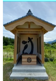
<ひょっこりうなぎのぼりパフェ> <うなぎのぼり神社>