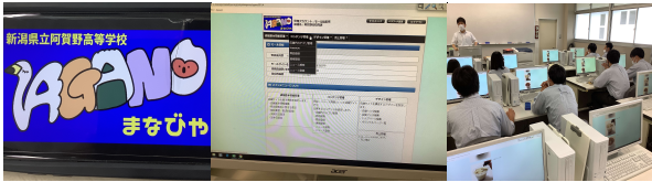
<ロゴデザイン> <ネット販売> <授業風景>

7月15日(金)の5,6限の学校設定科目の授業で、阿賀野市の商品をネット販売するための実践的な方策を学びました。ロゴの決定、販売ターゲットの設定、必要な情報リテラシーなど、本格的にネット参入するための準備をしました。この秋以降は生徒がサイバー空間を介してネット販売を行って参ります。