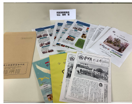
<活発な議論の様子> <当日の配付資料>